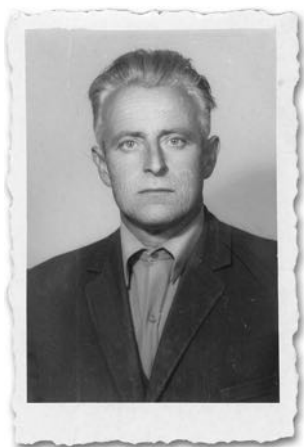
Обраг после родије